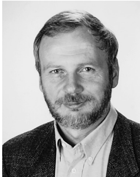
Prof. Dr. Hartmut Michel geb. 18. Juli 1948 in Ludwigsburg

Alta Trinità Beata. Gesammelte Studien zur altkirchlichen Trinitätstheologie, Tübingen, 2000.