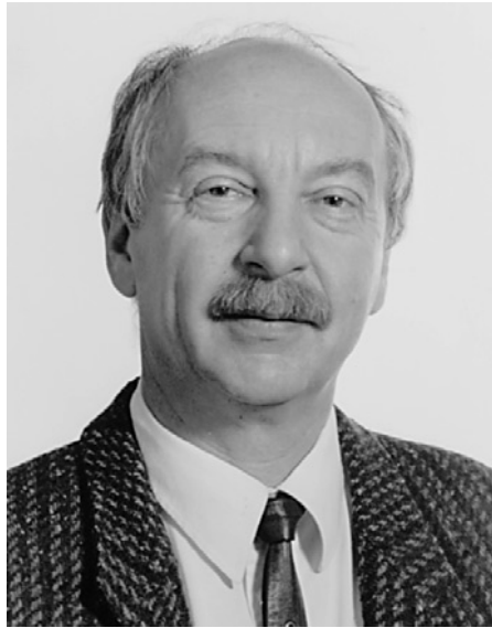
Prof. Dr. Gerd Gigerenzer geb. 3. September 1947 in Wallersdorf