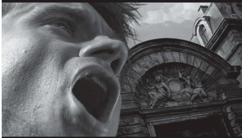
Abb. 5: Still aus Vidocq, Frankreich 2001.