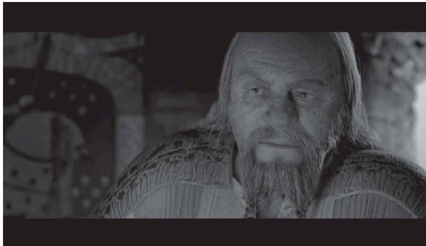
Abb. 2: Still aus Beowulf, USA 2007.