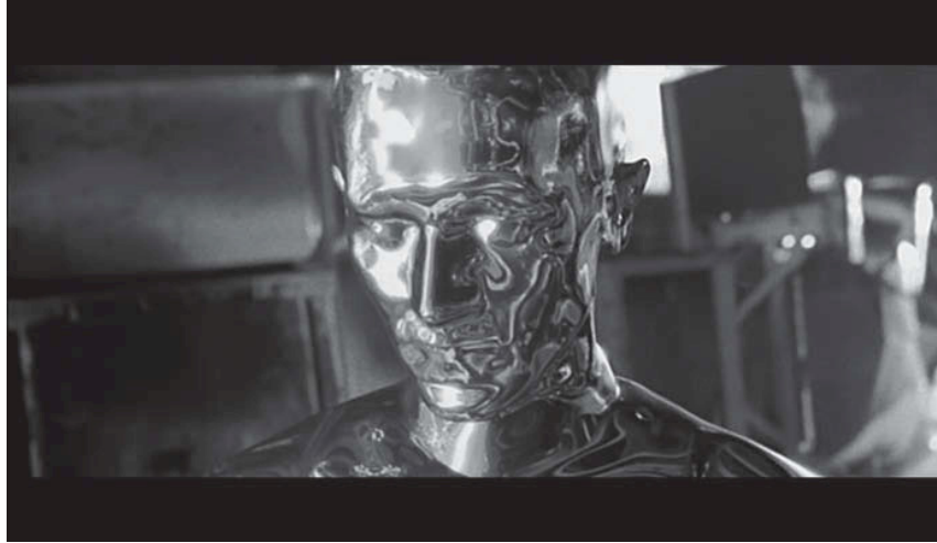
Abb. 1: Still aus Terminator 2, USA 1991.