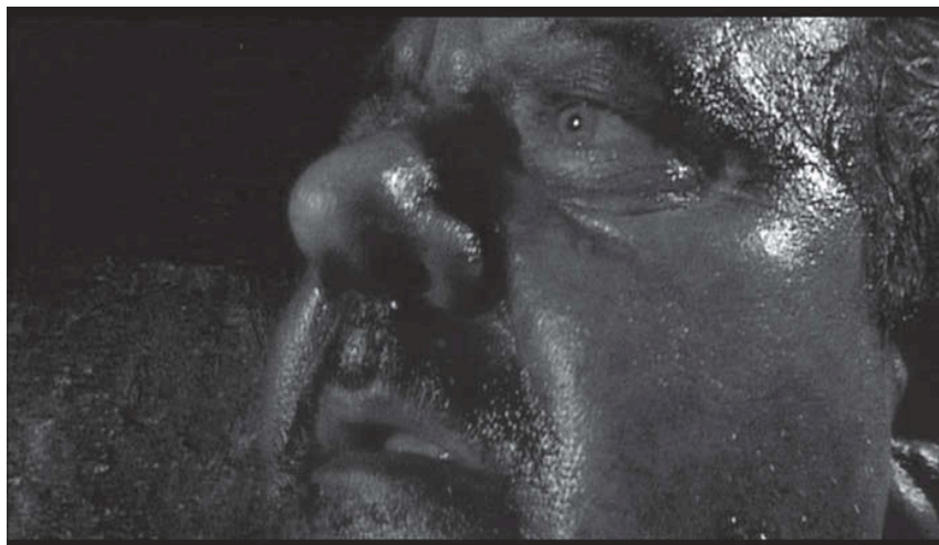
Abb. 6: Still aus Vidocq, Frankreich 2001.