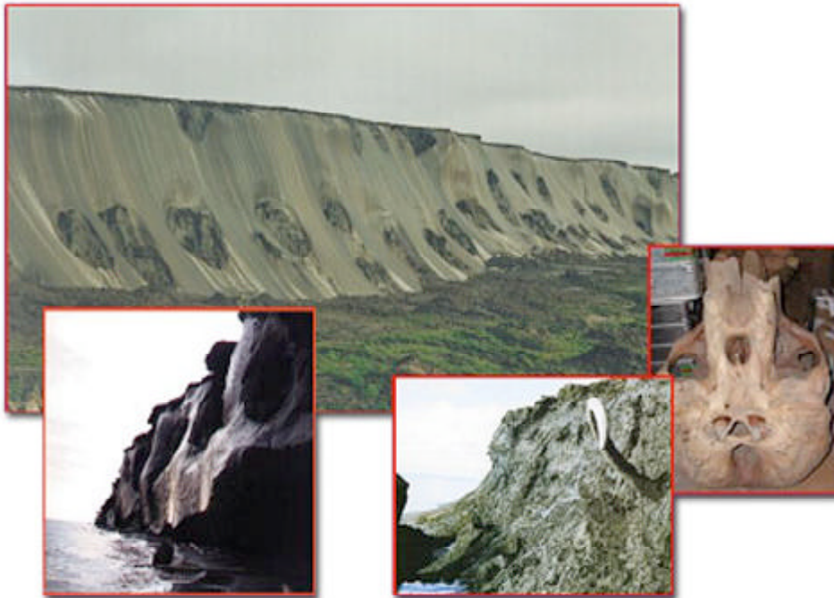
Abb. 5: Zerfallende Eiskomplexe an den Küsten des Laptev-Meerres. Ein aus dem Eis herausgeschmolzener Mammutzahn gibt ein Beispiel für die z. T. hervorragend erhaltenen Fossilien der Eiskomplexe.

Die älteren Teile der Eiskomplexe mit den hervorragend erhaltenen pleistozänen Groß-Säugerfossilien (Mammute etc., vgl. Abb. 5) unterliegen z. Zt. wegen der relativ warmen Sommer intensiven Abschmelzprozessen, vor allem entlang von Flussufern und den Küsten des Laptev-Meerres. Sie sind gleichzeitig hervorragende Archive einer Zeit, als NW-Eurasien von den Eisschilden der letzten großen Kaltzeit bedeckt waren, Nordsibirien mit seinen extrem kalten steppenähnlichen Polarlandschaften jedoch noch einen Lebensraum für eine diverse Fauna von Wirbeltieren und vermutlich auch für den Menschen bot.